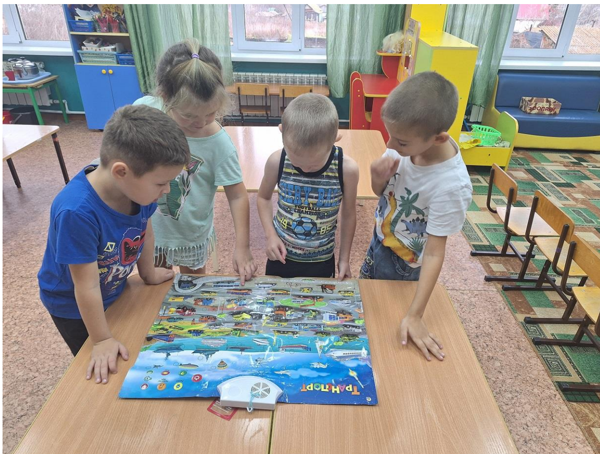
Звуковая игра «Транспорт»