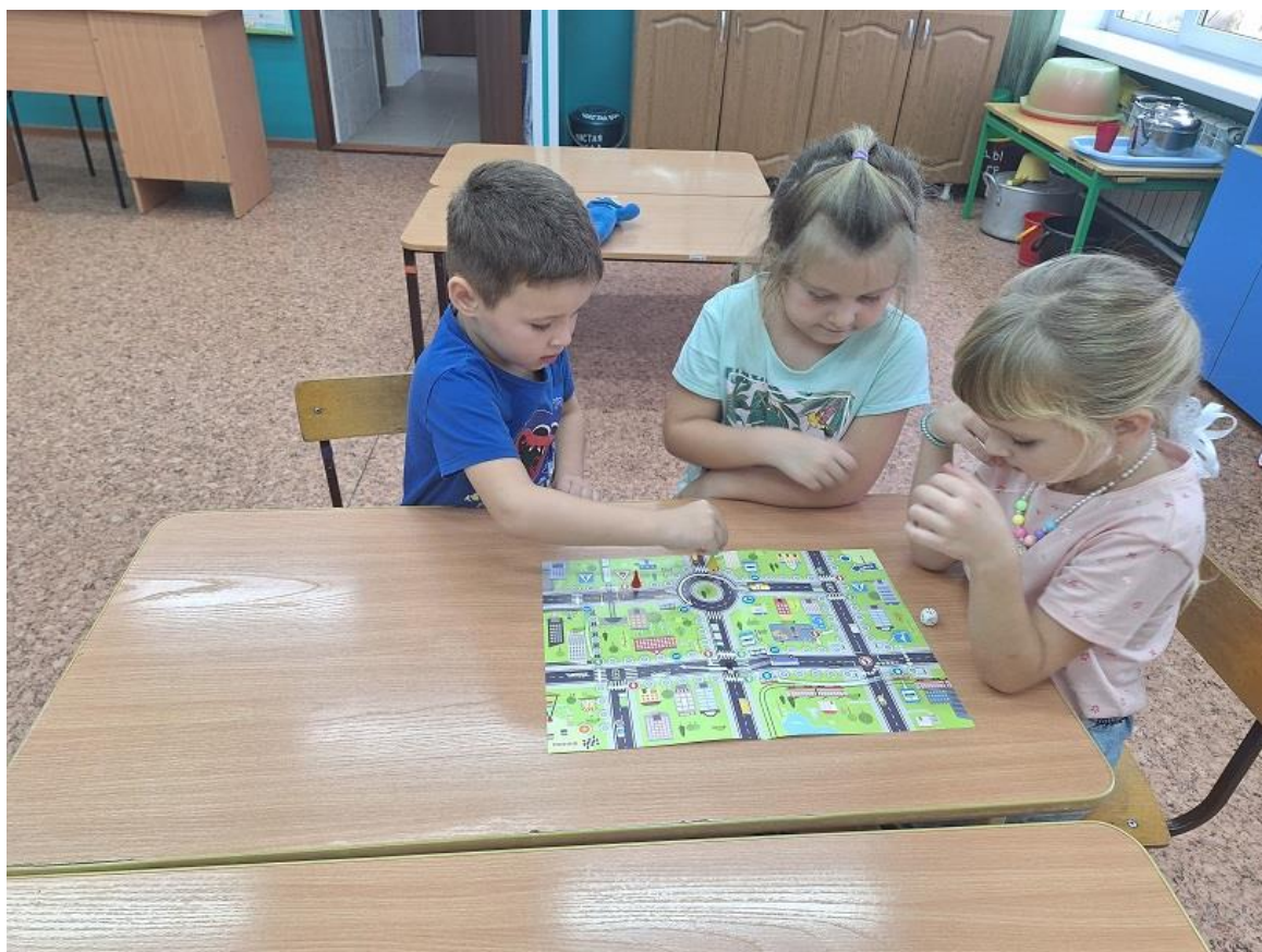
Настольная игра «Правила ПДД»