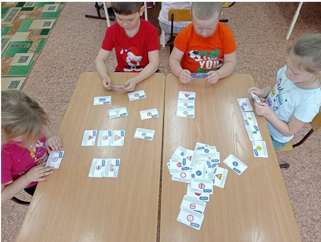
«Изучаем ПДД», «Дорожные знаки для пешеходов»