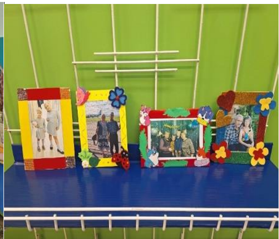
Ребята старшей группы вместе с мамами сделали фоторамки для своих открыток.