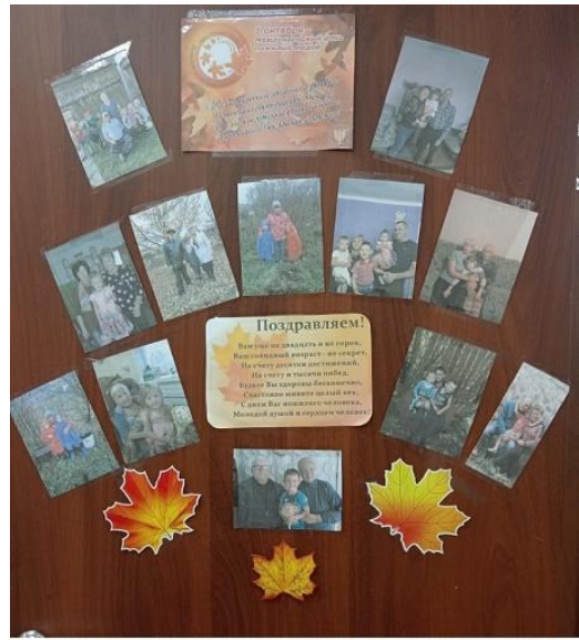
Работы ребят подготовительной группы.