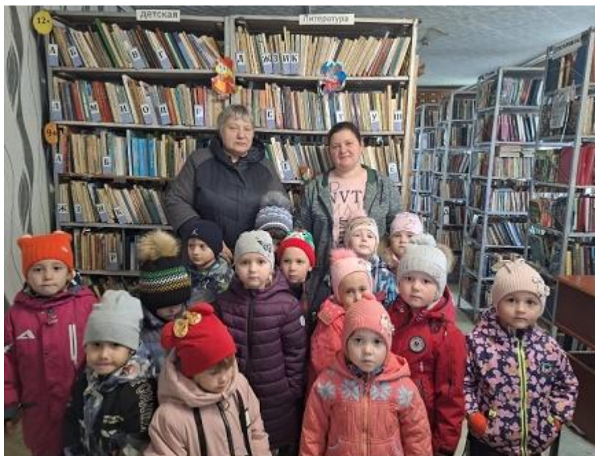
Воспитанники старшей группы в сельской библиотеке.

31 октября- день рождения пешеходного перехода.