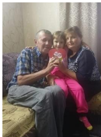
Воспитанники младшей группы.